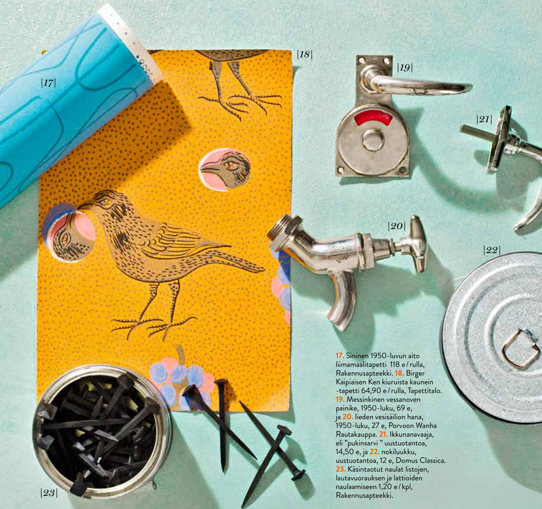
17. Sininen 1950-luvun aito liimamaalitapetti 118 e / rulla, Rakennusapteekki. 18. Birger Kaipaisen Ken kiuruista kaunein -tapetti 64,90 e / rulla, Tapettitalo. 19. Messinkinen vessanoven painike, 1950-luku, 69 e, ja 20. lieden vesisäilion hana, 1950-luku, 27 e, Porvoon Wanha Rautakauppa. 21. Ikkunanavaaja, eli "pukinsarvi" uustuotantoa, 14,50 e, ja 22. nokiluukku, uustuotantoa, 12 e, Domus Classica. 23. Käsintaotut naulat listojen, lautavuorauksen ja lattioiden naulaamiseen 1,20 e / kpl, Rakennusapteekki.