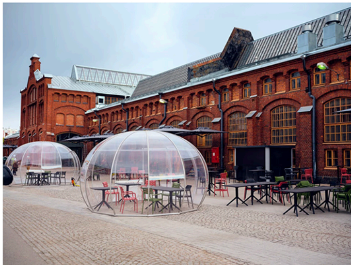
Terassilla sijaitsee kuplia, jotka ravintola Tähdän asiakkaat voivat varata omaan käyttöönsä.

Riistaman ja Sarajärvi haluavat houkutellessa paikalle myös turisteja. Heidän tavoitteenaan on, että koko Train Factorysta tulee paikka, jonka suomalaiset esittelevät ulkomaisille vierailleen.