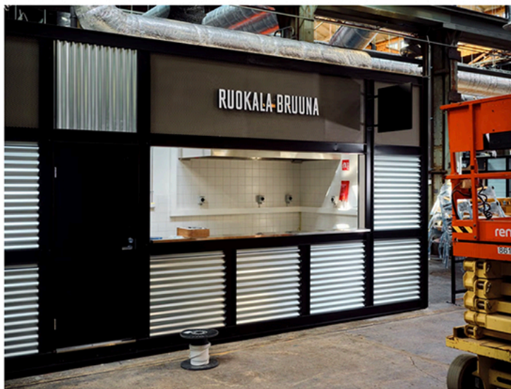
Yksi ravintolamaailman ravintoloista on Ruokala Bruuna.

Sisällä ravintolamaailmassa on iso näyttö sekä esiintymislava. Toinen näyttö ja lava löytyvät myöhemmin myös ulkona terasseilta. Tarkoituksena on, että tiloissa järjestetään erilaisia tapahtumia. Seuraavan kuukauden aikana tiloissa voi katsoa jääkiekon ja jalkapallon MM-kisoja, Riistama kertoo.